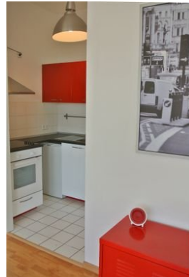
Hauptzimmer und Küche