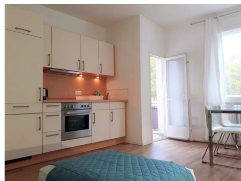
Küchenzeile und Balkontür