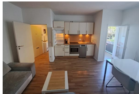
Hauptzimmer und Küchenzeile